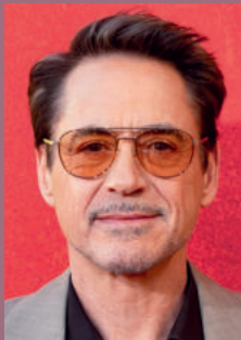
ROBERT DOWNEY JR.

KEVIN COSTNER Für diesen Traum gab er seine Ehe auf